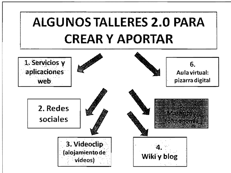
Figura 2: Talleres 2.0 para crear y aportar en la formación del profesorado. Elaboración propia.

Con espíritu deportivo es necesario entrenarse y ejercitarse con actitud creativa aportando en talleres lo que se ha ido aprendiendo y asumiendo en las sesiones formativas anteriores.