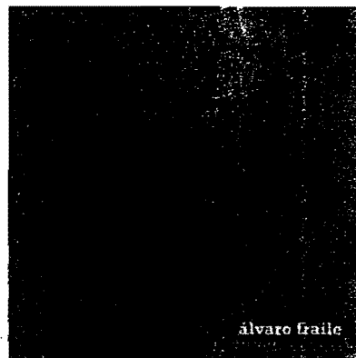
Imagen 1. Portada del Disco "Nosobranlasnubes" (2010) de Álvaro Fraile y títulos de los temas que incluye.

ensayo y error todo va bien buenas intenciones voy dale la vuelta todo es perfecto nada tristeza alegría mis legañas aunque me veas dudar