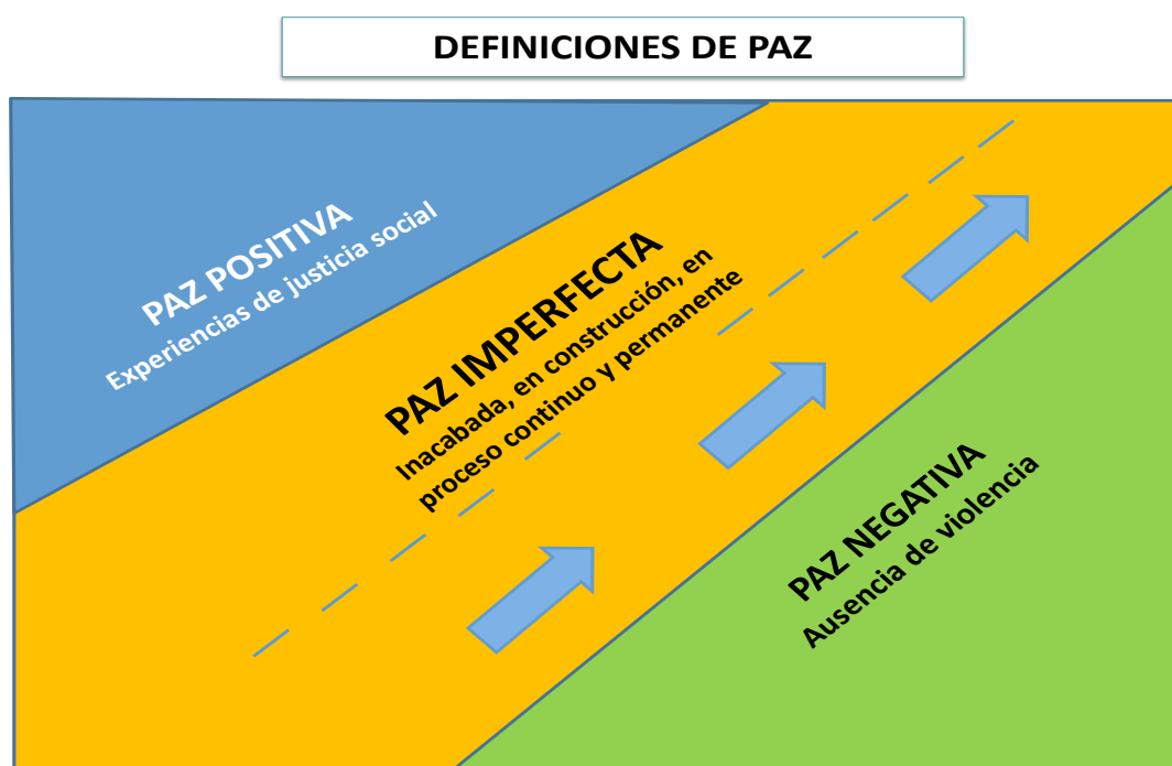
Figura 1 – Definiciones de paz

Fuente: La figura muestra una descripción gráfica de las definiciones de paz, destacando la paz imperfecta de avance y construcción diaria. A partir de Muñoz, F.A. (2001).